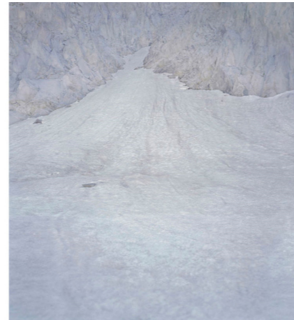
Glaciar de Aneto, 2011

Se completa la exposición monográfica con la vídeo proyección de Javier Vallhonrat La sombra incisa (2016), en la sala Cámara oscura . Durante unas tres o cuatro semanas del mes de agosto el glaciar muestra su superficie de hielo al perder la cubierta de nieve que lo protege. Entre 2016 y 2018 Vallhonrat permaneció de forma intermitente junto al límite del hielo glaciar registrando fragmentos de su perímetro y realizando este vídeo. Para ello transformó una tienda de alta montaña en cámara oscura, fundiendo en un mismo dispositivo, registro y hábitat provisional. Permanecer junto al glaciar permitió la observación minuciosa de incontables gestos y el contacto con su cambiante materialidad.