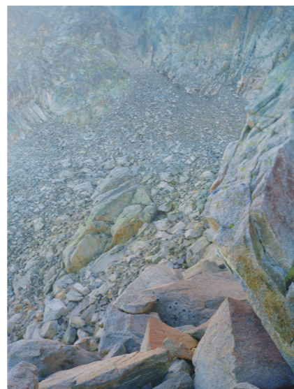
Barranco de la Maladeta, 2011