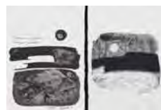
Paisajes mi perspectiva. Campos quemados , 1999 Acuarelas sobre papel Publicadas en la revista "Turia"