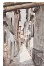
Sin título , sf Acuarela sobre papel