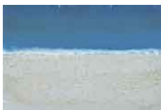
Horizonte , sf Carborundum sobre papel 32/50 Edición de 50 ejemplares