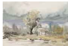
Sin título , sf Acuarela sobre papel