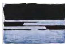
Sin título , sf Acuarela sobre papel