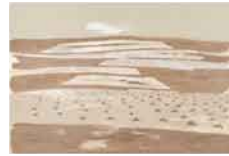
Cielo verde/Cuarte , sf Serigrafía sobre papel 142/250 Edición de 250 ejemplares