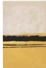
Sin título , sf Serigrafía sobre papel H/C Edición de 100 ejemplares