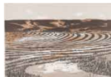
Campos mojados , sf Serigrafía sobre papel 84/250 Edición de 250 ejemplares