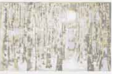
Sin título , sf Serigrafía sobre papel H/C 3/ 5 Edición de 5 ejemplares