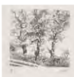
Sin título , sf Aguafuerte sobre papel H/C Edición de 100 ejemplares