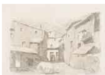
La Porteta , 1949 Aguafuerte sobre papel P/A IX/XXV Edición de 100 + XXV ejemplares