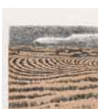
Rastrojos , 1983 Aguafuerte sobre papel H/C Edición de 100 ejemplares