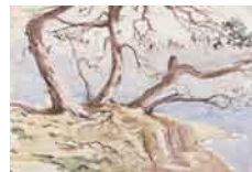
Sin título , sf Acuarela sobre papel