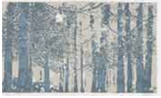
Bosque de hayas , 1991 Serigrafía sobre papel 50/100 Edición de 100 + XXV