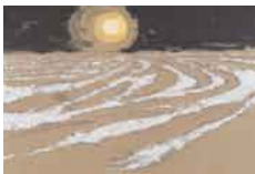
Tierras , sf Carborundum sobre papel 27/40 Edición de 40 ejemplares