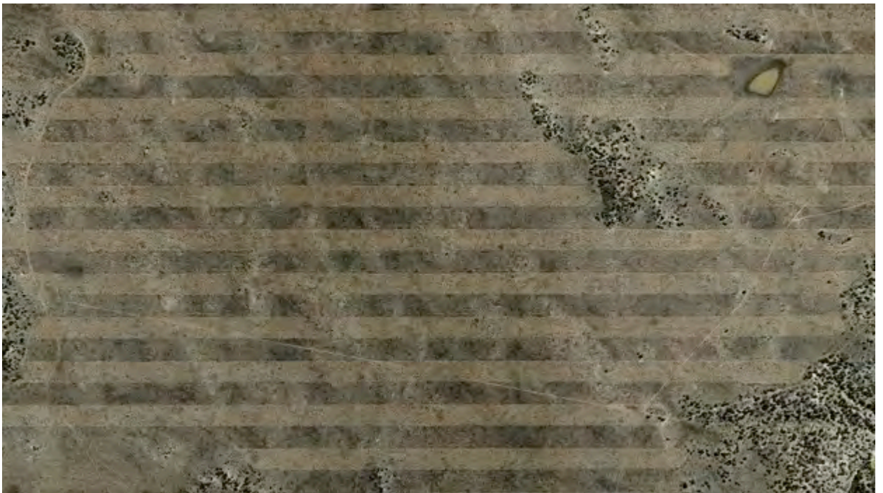
Imagen aérea de satélite e impresión TEXTBACLIGHT 4 y manipulación digital. 70*2,7*124