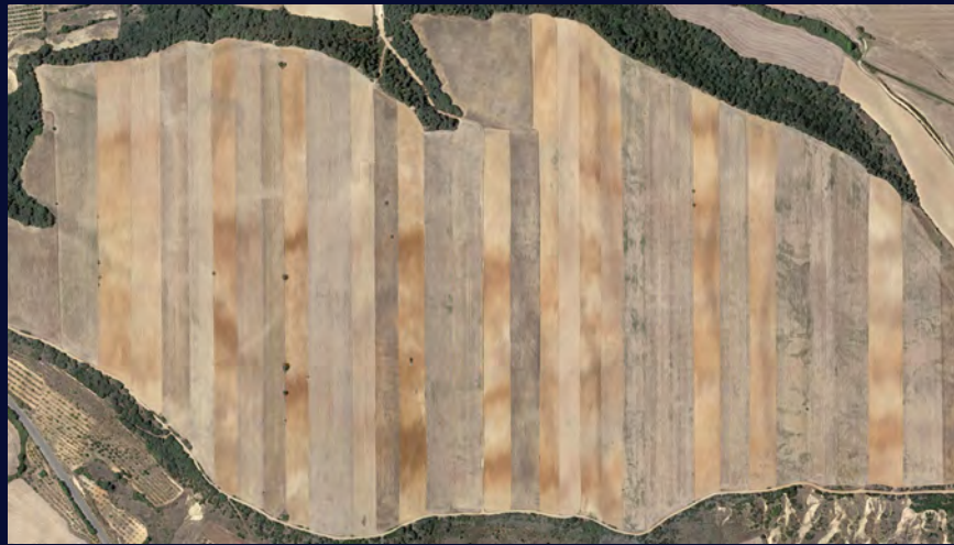
Líneas en Los Corrales (Huesca)

AVENIDA DOCTOR ARTERO S/N 22004 HUESCA. ESPAÑA. WWW.CDAN.ES