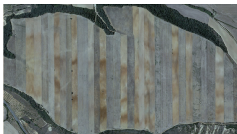
Líneas en Los Corrales (Huesca).

El CDAN desea generar en esta sala un espacio de ideas, un lugar de trabajo a modo de exposición en proceso, para fomentar la capacidad crítica y activa por parte del espectador.