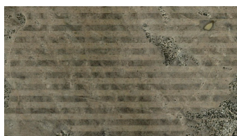
Mato Grosso. Sudamérica

Serie: Desde otro punto de vista. Altura ojo: 1.700 mts QFE. 2.018. Pieza: Caja de luz iluminada por leds con imagen aérea de satélite e impresión TEXTBACLIGHT 4 y manipulación digital.. Dimensiones: 124 cms. * 70 cms.