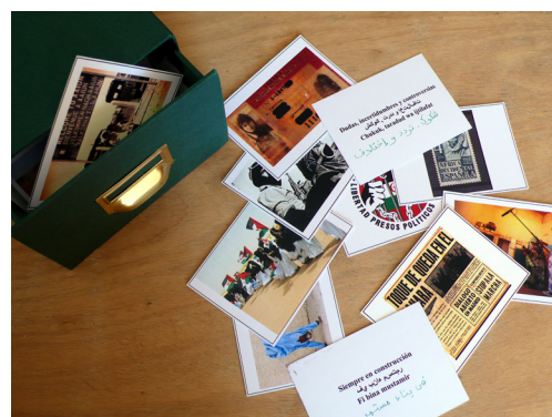
Colectivo Tuiza, Caja Hassania, El Hassania en 1000 palabras , archivo, 2014.