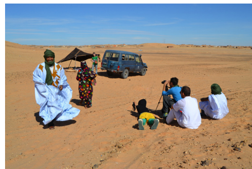
Colectivo Left Hand Rotation, Western Sahara , vídeo, ARTifariti, 2012.