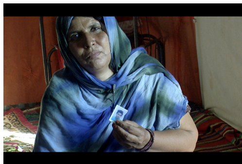
Carmen F. Sigler, Luna Memoria de los desaparecidos saharauis , vídeo, 2011.

Mediante el estudio de obras de arte, se lleva a cabo un análisis de la realidad social y cultural saharauí, al tiempo que se reflexiona en torno al concepto de territorio, como una porción de superficie terrestre perteneciente a una comunidad o nación en exilio, pero también como un campo o esfera de acción, y se pone en cuestión un proceso fallido de descolonización que continúa en el tiempo presente. La muestra intenta superar el “metarrelato” construido en torno al Sáhara, cuya narrativa épica ha forjado un mito, con una gran carga ética y estética, pero ausente de valor crítico.