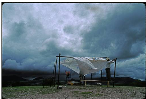
Pedro Meyer. La mixteca . Oaxaca. México. 1991

C'est dans la quotidienneté, dans le collectif mais intime, que réside la nature défiante du travail de Pedro Meyer. Une habilité consommée pour visualiser l'intensité et l'incalculable diversité de la vie humaine qui, sinon, resterait masquée.