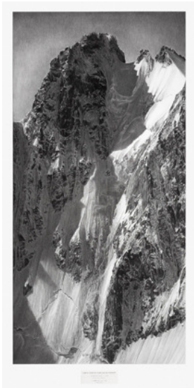
Cara norte de l'Aiguille du Triolet , 2000, Colección CDAN