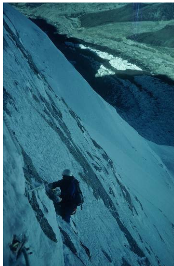
Everest'82 , 1982, DVD, 7 min.