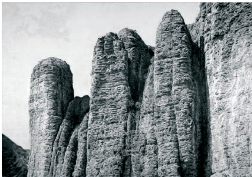
Lógris VI, 2011.

HUESCA CENTRO DE ARTE Y NATURALEZ (CDAN)