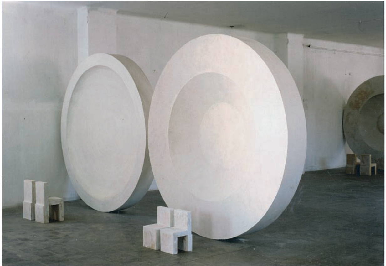
Chisme, 1991. Museu Comarcal de la Garrotxa, Olot (Girona).