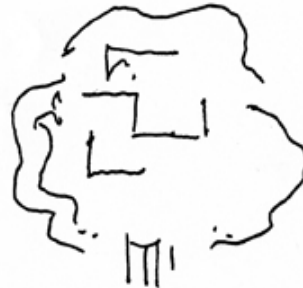
Croquis del CDAN. Rafael Moneo

Entre sus proyectos destacan el edificio Bankinter, 1972-1977 (Madrid); Museo de Arte Romano de Mérida, 1980-1985; nueva estación de Atocha, 1985-1988 (Madrid); Museo Thyssen-Bornemisza, 1989-1992 (Madrid); Fundació Pilar i Joan Miró 1987-1993 (Palma de Mallorca); Centro Cultural y