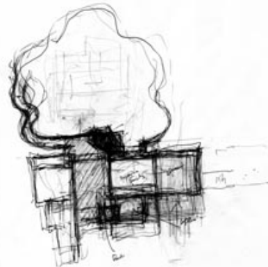
Croquis del CDAN. Rafael Moneo