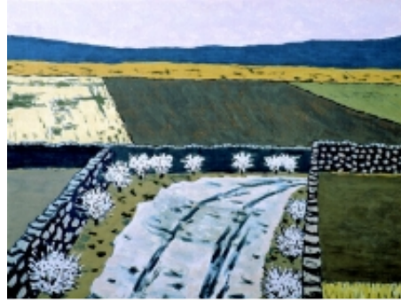
Godofredo Ortega Muñoz. Paisaje . c. 1977

La colección pictórica está formada por 64 pinturas donadas en 1994, todas ellas