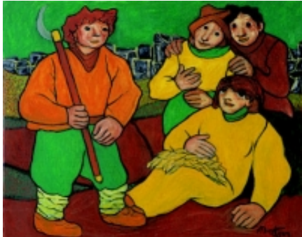
Francisco Mateos. El miedo , 1971